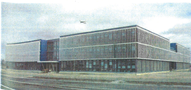
Von Cadolto an die Flughafen München GmbH schlüsselfertig übergeben: Das neue, 6840 m 2 große Gebäude in Modulbauweise für den Geschäftsbereich Real Estate der Flughafen München GmbH.

Ein besonderes Highlight ist der Sonnenschutz in Tragflächenform an der vorgehängten Trespa-Fassade. Das EG wird optisch mit einer Pfosten-Riegel-Fassade abgesetzt.