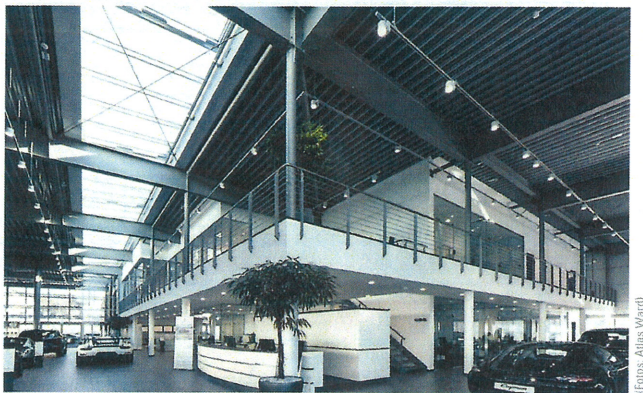
Bild 3 Im Inneren wurde das Stahlhallengerüst an einen massiven Betonkern angeschlossen. Dabei gründen die Innenstützen auf verschiedenen Niveaus, etwa auf hochgelagerten Galerieebenen.