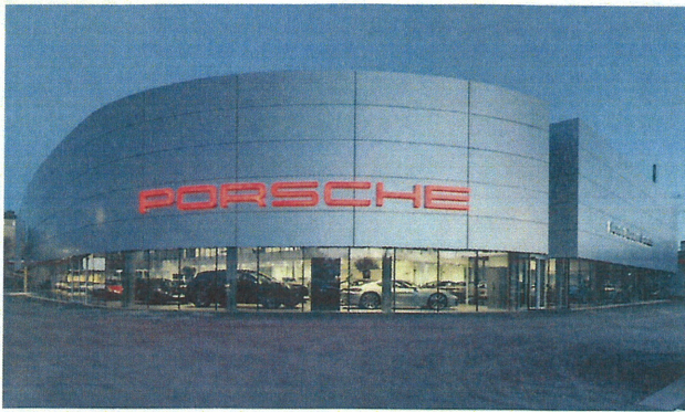
Bild 1 Der Look des neuen Porsche Zentrums Wiesbaden trägt eine unverwechselbare Handschrift. Blickfang ist die abgerundete, zweischalige Schauraum-Fassade.

arbeit wurde das Stahlhallengerüst mittels gebogener Träger an die geschwungene äußere Form des optisch dominanten Schauraums angepasst und im Inneren an einen massiven Betonkern angeschlossen. Dabei gründen die Innenstützen auf verschiedenen Niveaus, etwa auf hochgelagerten Galerieebenen. Zum Stahlpaket gehörten außerdem eine kleine Überdachung für Gebrauchtwagen und ein separates Lagergebäude.